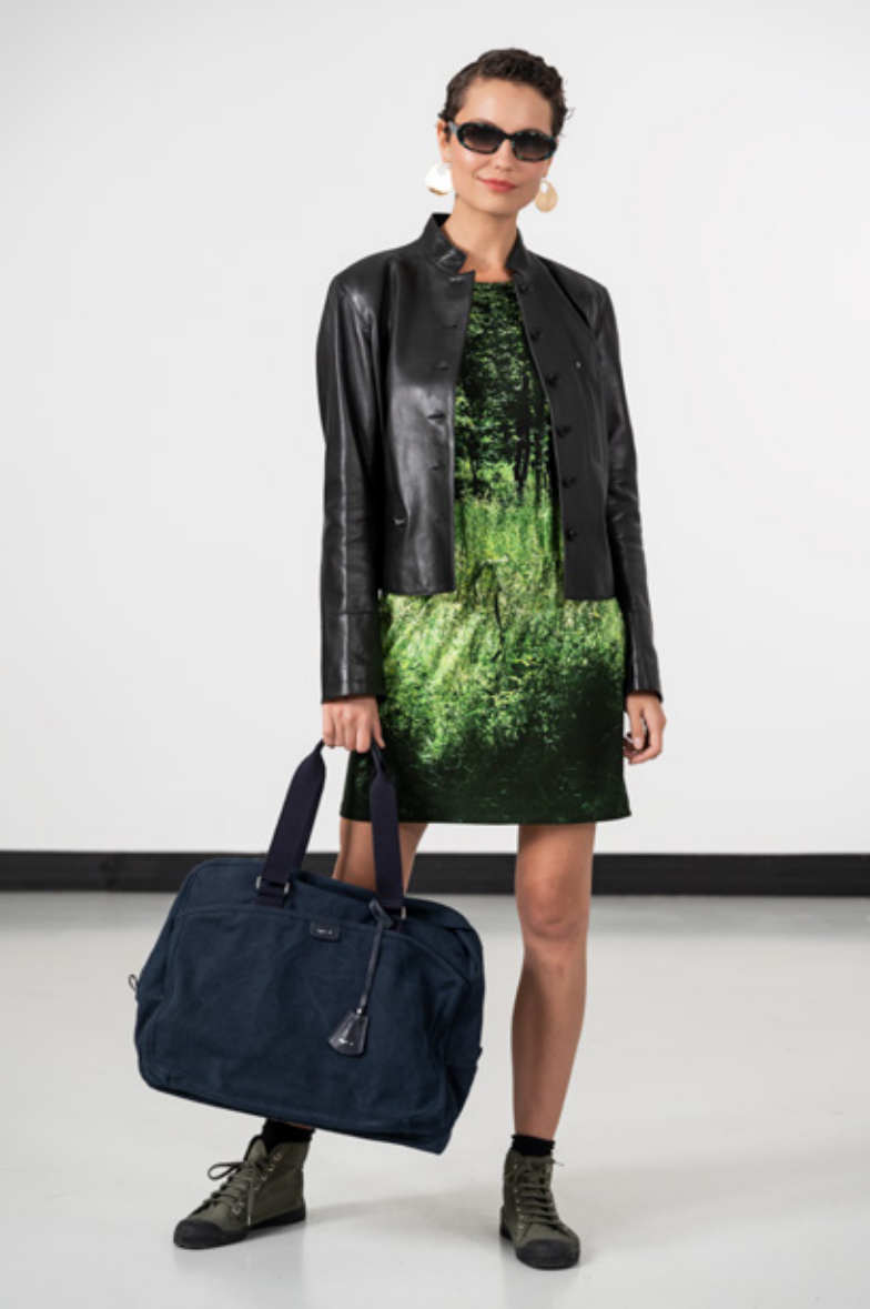
Blouson Tambourin, col officier boutonné en cuir d'agneau plongé noir Robe New Idole en jersey de viscose, longueur genou, lien à la taille, impression numérique "Les Bois, Herbes Hautes", photo d'Agnès