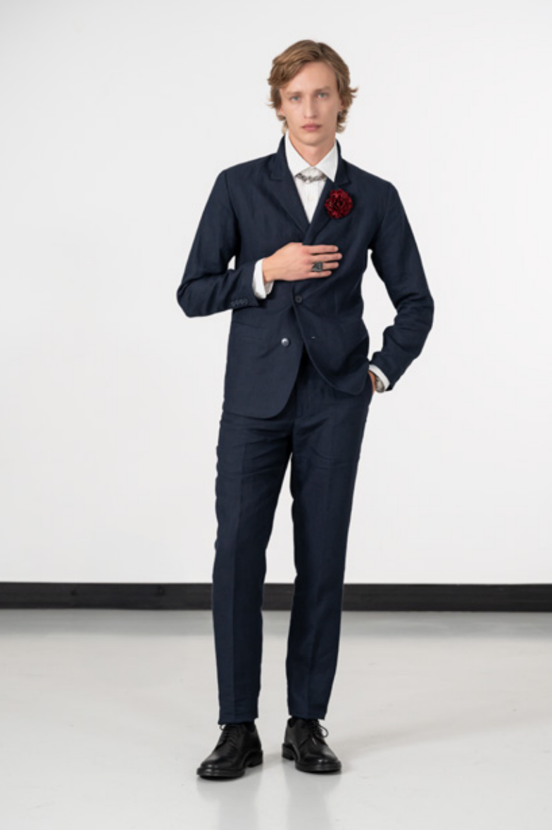
Costume en lin bleu Chemise écreu en coton/viscose rayé grise