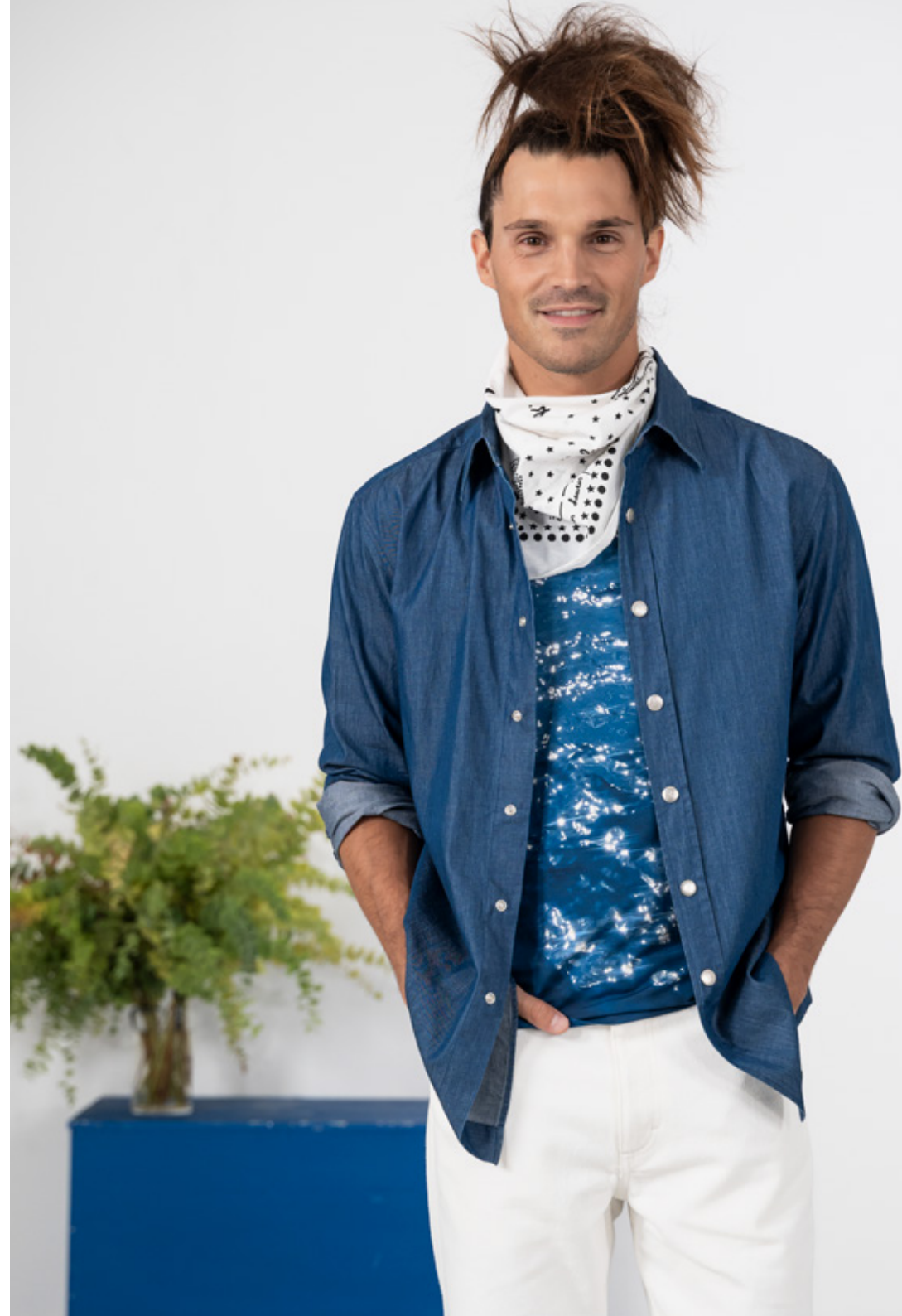
Shirt in cotton chambray with "b." metal press, denim colorway La Mer short-sleeve T-shirt, digital print, photos by Agnès White cotton jeans