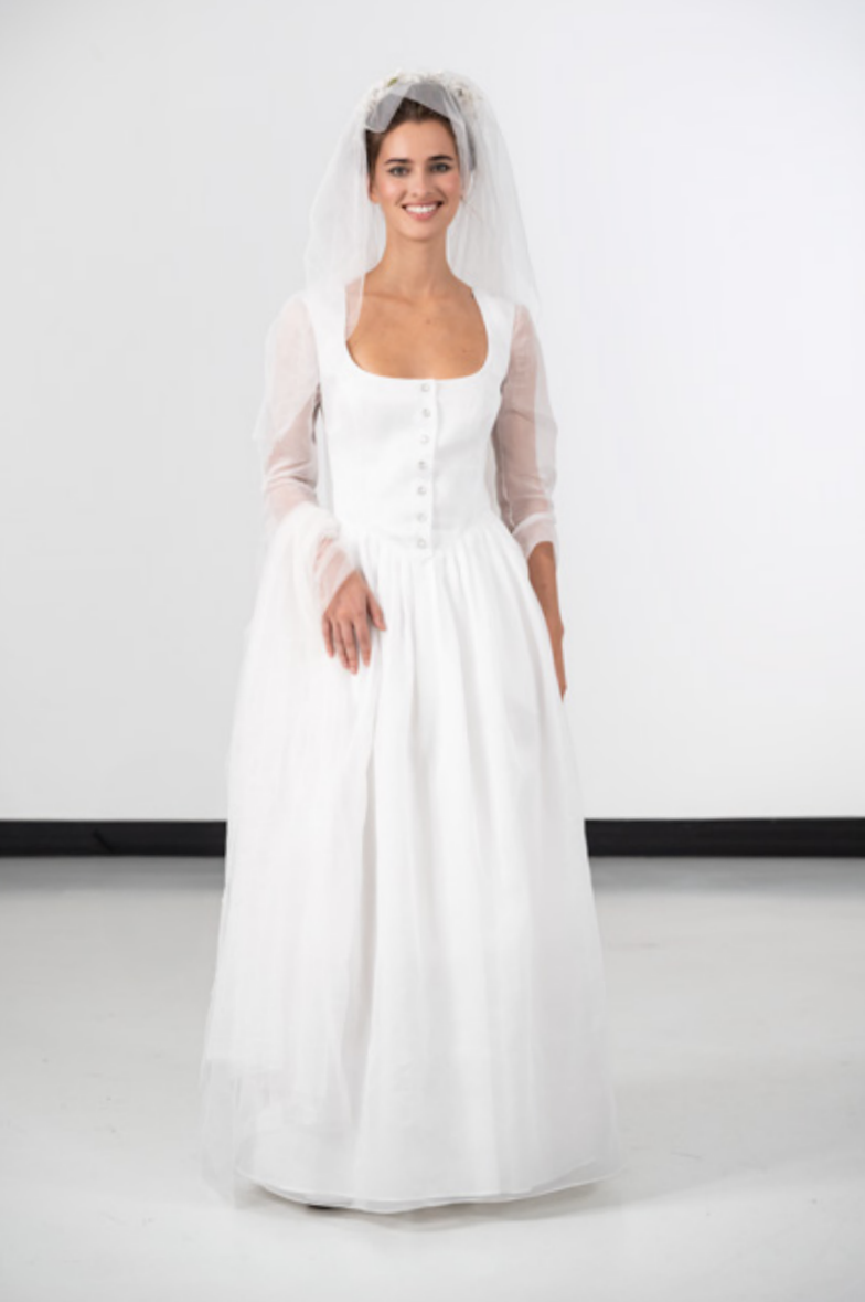
ROBE ZF41 UG05 010 SANDALES FEUILLES 108C CU52 050

Robe de mariée longue en organdi blanc, bustier décolleté carré, boutons pressions nacre, laçage au dos, manches longues transparentes, jupon à plis