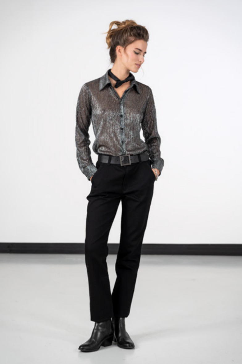
Chemise Boys Boys en crépon brillant coloris argent Jean Marilyn droit taille haute noir