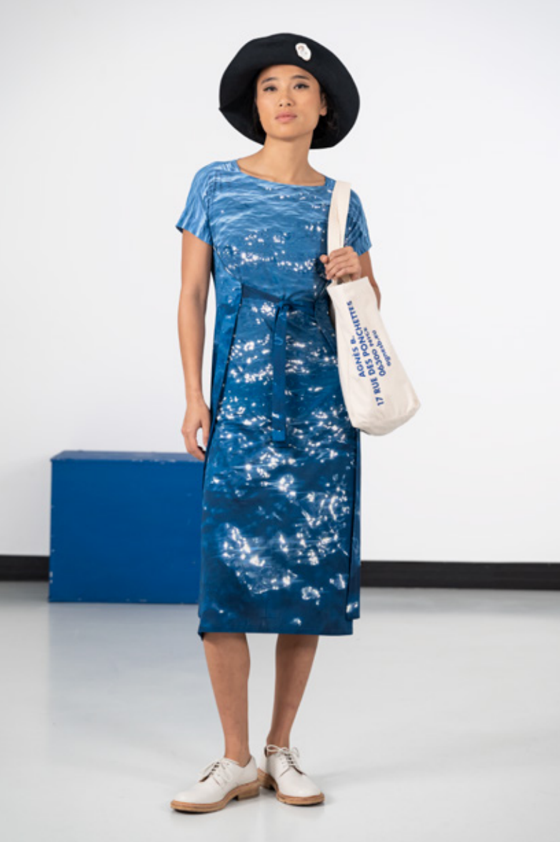
Robe paréo sans manches à nouer devant ou dos en jersey de viscose, impression numérique "La Mer", photos d'Agnès