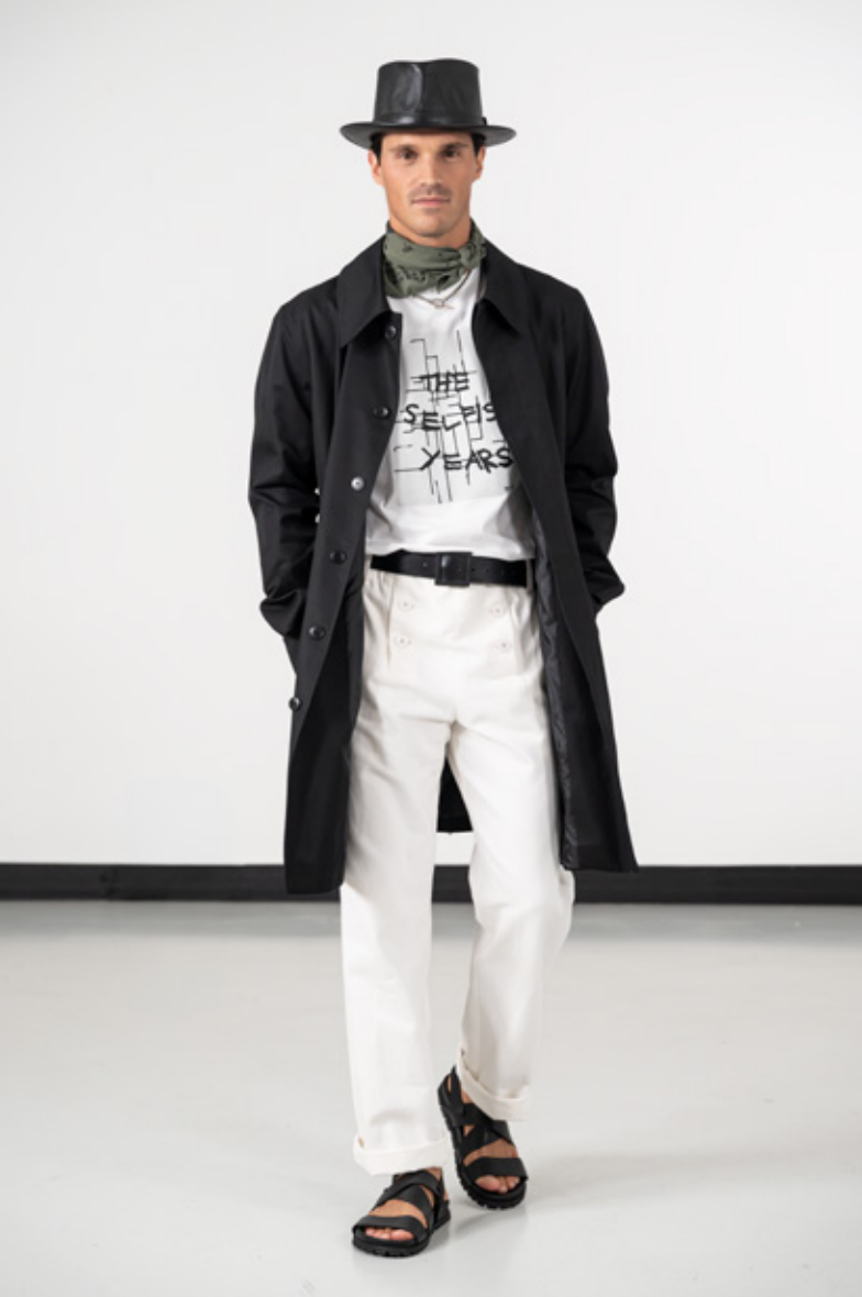
Imperméable déperlant noir T-shirt d'artiste en coton blanc © Jim Jo Jean en toile de coton blanc