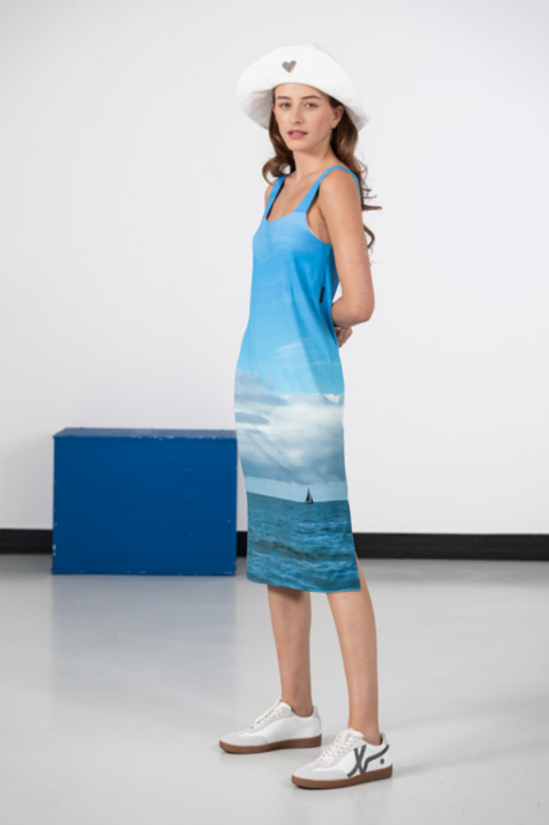
Robe Tiphania droite à bretelles en jersey de viscose longueur genou, impression numérique "À la plage", photo d'Agnès