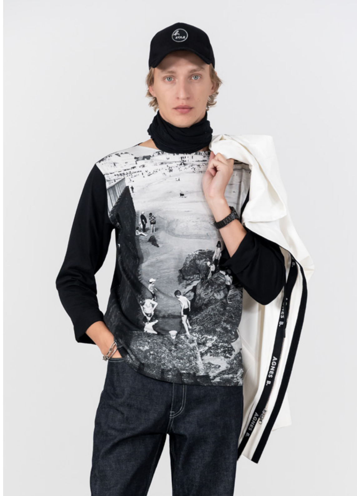
White zip-up waxed jacket made in France by Dolmen manufacturers Long-sleeved cotton jersey T-shirt, "Quiberon" digital print, photo by Agnès Raw denim jeans in white topstitched Japanese canvas