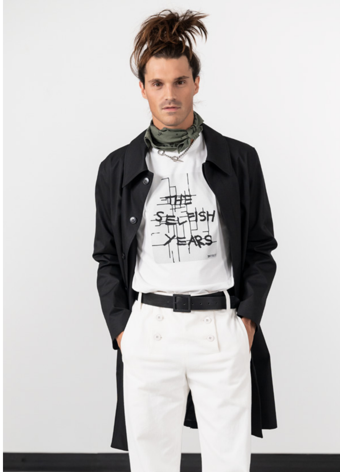
Black water-repellent raincoat White cotton artist T-shirt © Jim Jo White cotton canvas jeans