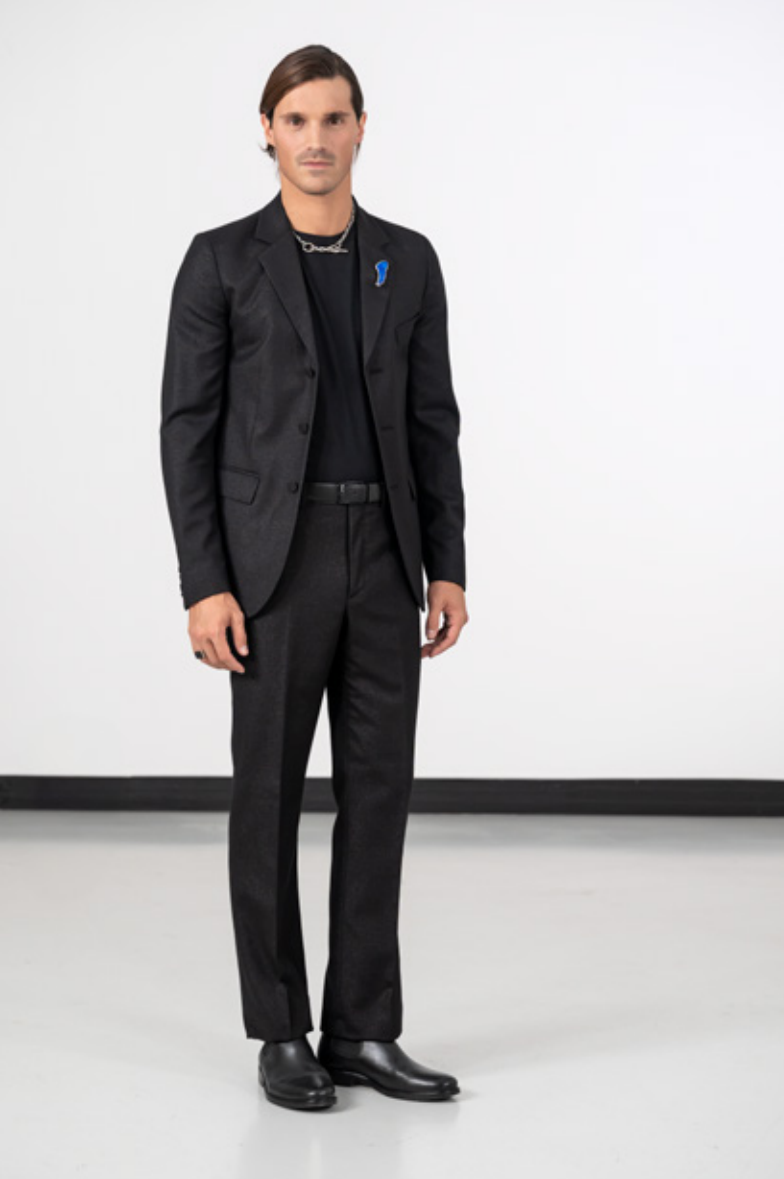
Veste de costume 3 boutons en drap de laine et Lurex T-shirt à manches courtes Coulos Pantalon de costume en drap de laine et Lurex