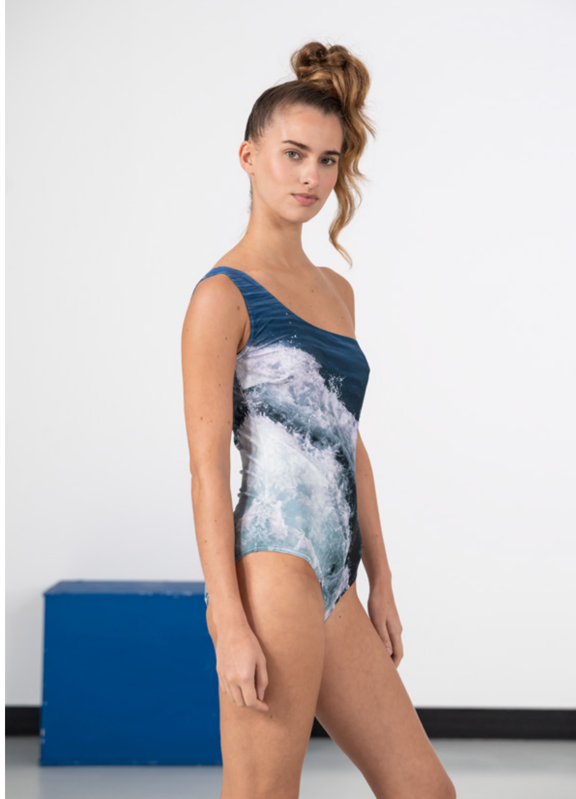
Lorca asymmetric swimsuit, "Vague" digital print, photo by Agnès