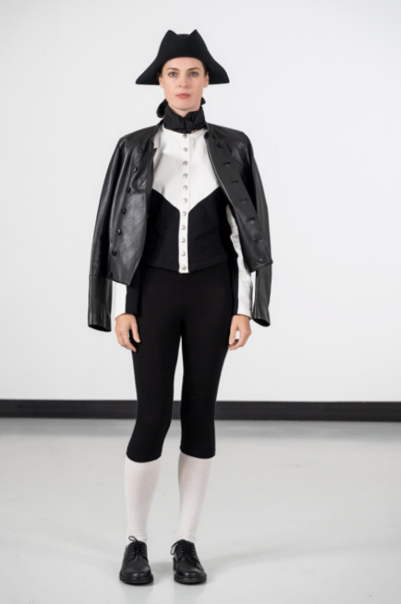
Blouson fife en cuir d'agneau plongé noir, boutonnage en diagonale, col officier Cardigan New Two pression métal en coton bicolore noir et blanc Caleçon genou en jersey de coton noir