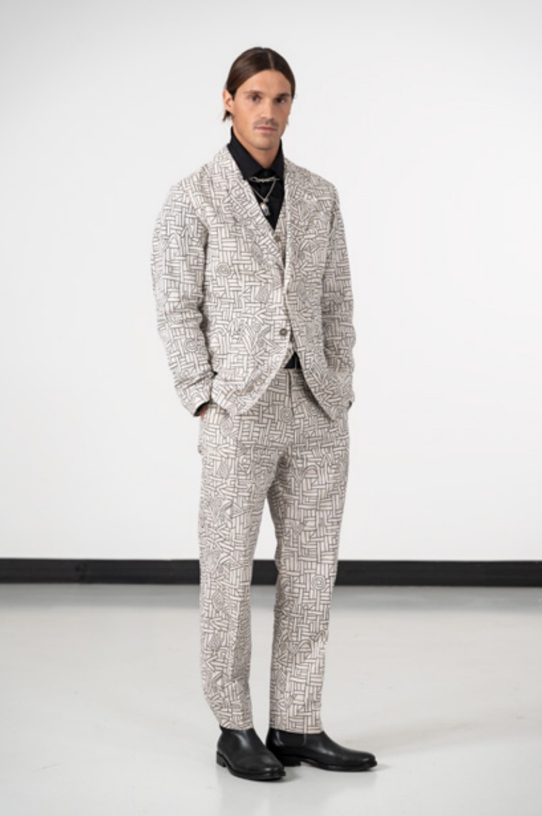
Costume 3 pièces en chanvre, imprimé archives personnelles d'Agnès Chemise en popeline de coton noir à col cassé