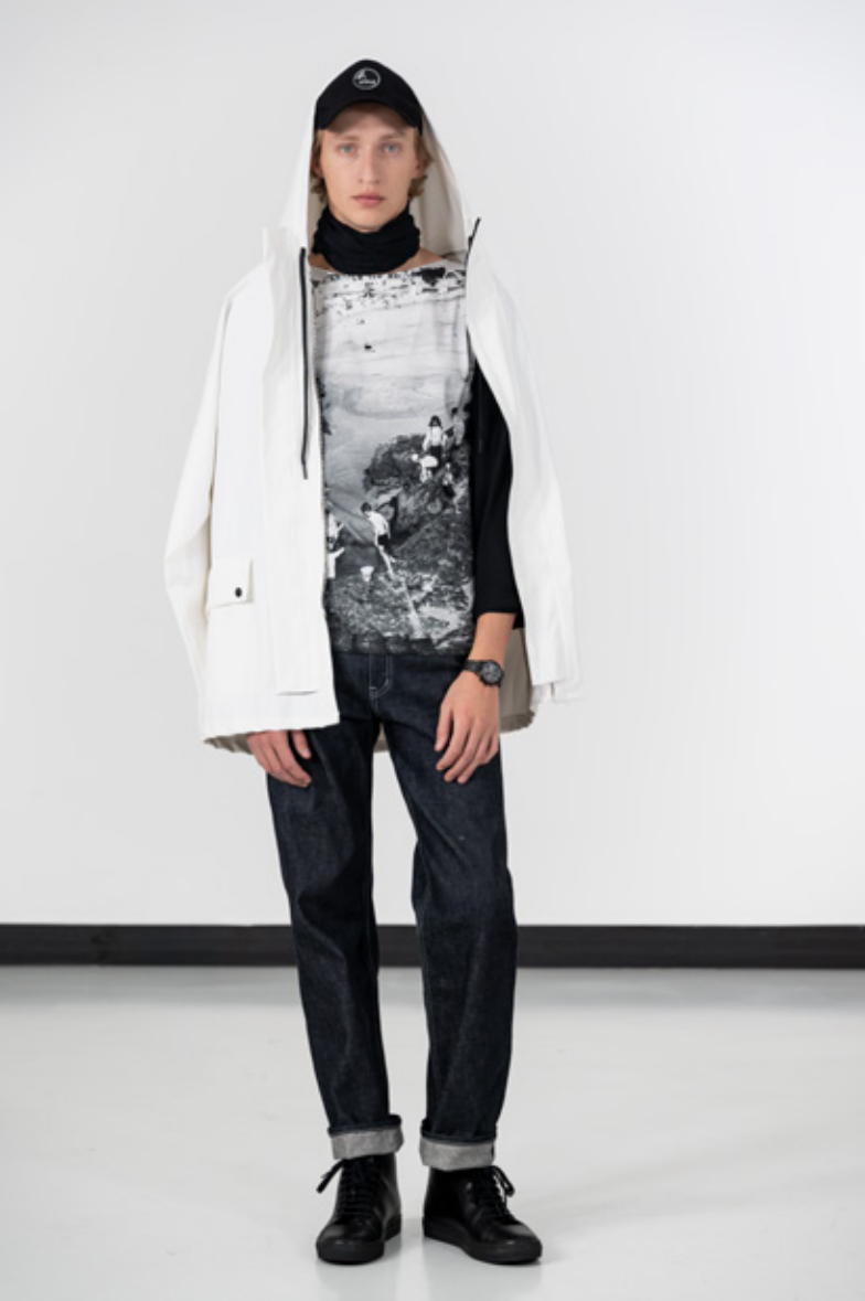
Ciré zippé blanc fabriqué en France par la manufacture Dolmen T-shirt à manches longues en jersey de coton, impression numérique "Quiberon", photo d'Agnès Jean denim brut en toile japonaise surpiqué blanc