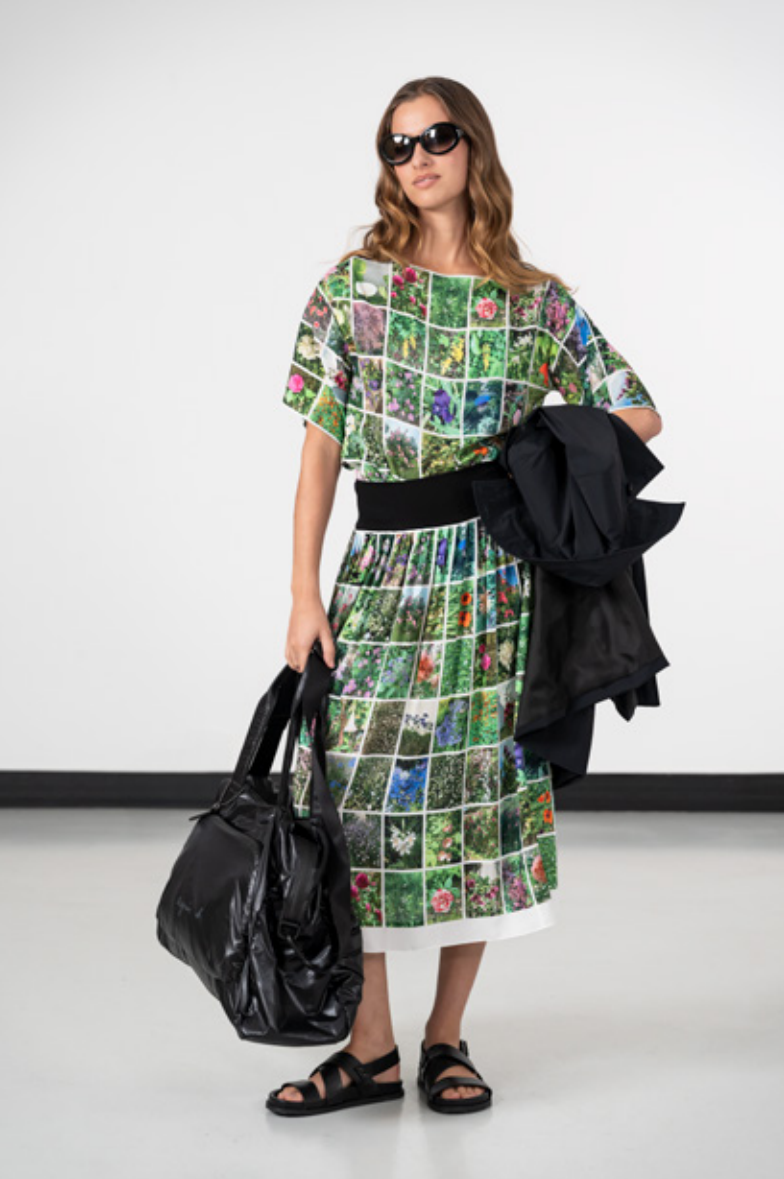
Caban Bristol à double boutonnage déperlant Haut encolure bateau, manches courtes en viscose, impression numérique, photos Instagram d'Agnès @agnes_b_senga