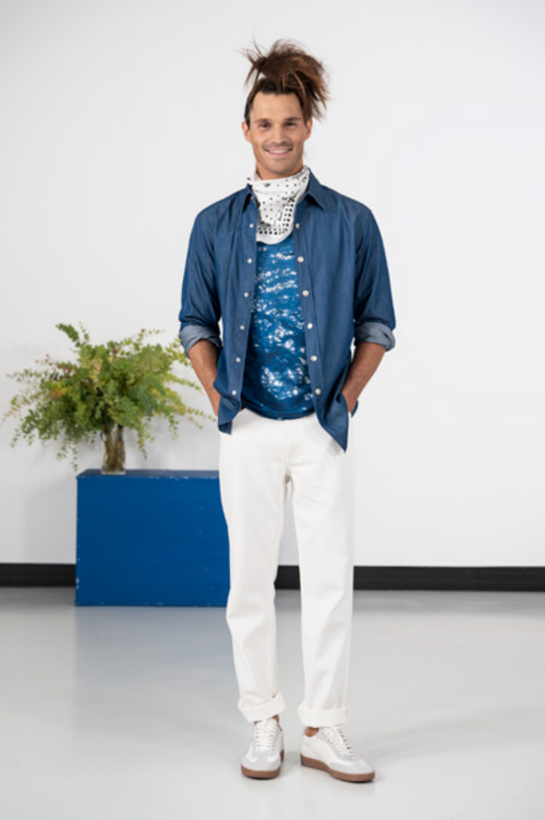
Chemise pression métal "b." en chambray de coton, coloris denim T-shirt manches courtes impression numérique "La Mer", photos d'Agnès Jean en coton blanc