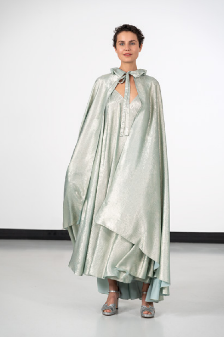
Cape longue à capuche en polyester, coloris cardamome Robe longue à bretelles en polyester, coloris cardamome