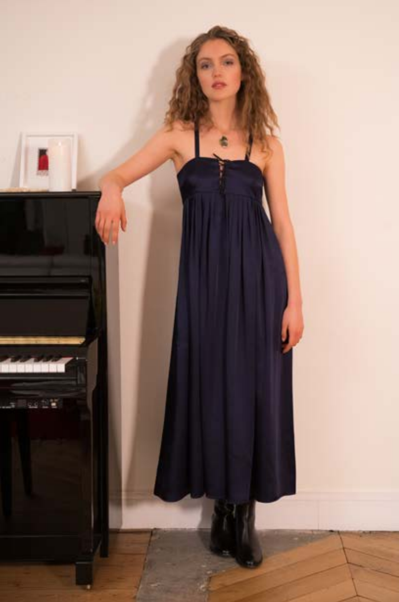
Robe longue à bretelles, bustier lacé, en viscose mélangée violet Strapless long dress, laced bustier, in purple mixed viscose

ROBE ZE45 UBQ4 582 BOTTINES ROCK 2795 CU01 000 COLLIER OR AVEC PIERRE PIECE UNIQUE