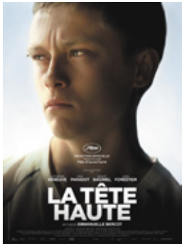
la tête haute (2015 - Emmanuelle Bercot)