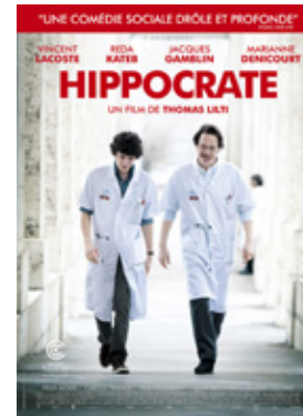
Hippocrate (2015 - Thomas Lilti)