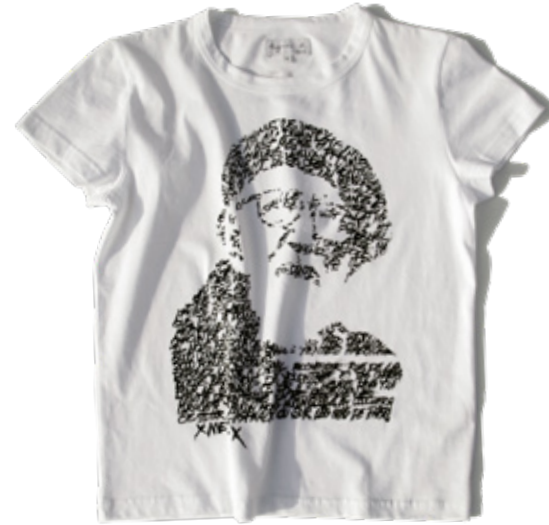
t-shirt d'artiste agnès b. vendu au profit de la Fondation Abbé Pierre

Born in 1963, JonOne grew up in Harlem, New York. Painter, graffiti artist, sculptor, he began his career during the 70s by writing his name on walls and subways, which according to him, are «museums which cross the city.» He moved to Paris at the beginning of the 80s, where he began to work on movement, color, freedom of his line, revealing his imagination and his optimistic vision of our society. He met agnès b. and first showed his work at the galerie du Jour in 1989. Their friendship gave rise to numerous collaborations: performances, painting murals and clothing, including a t-shirt sold to benefit the Fondation Abbé Pierre. Recognized by galleries and the art market, JonOne is one of main characters of today's international street art scene.