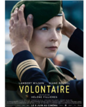
Volontaire (2018 - Hélène Fillières)