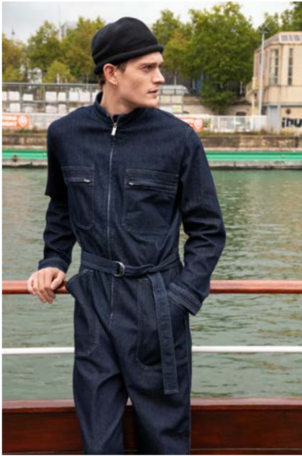
3 combinaison en toile denim bleu, tee-shirt manches courtes «everyone is entitled to my opinion» bleu marine blue denim boiler suit, short-sleeved navy-blue T-shirt “everyone is entitled to my opinion”

COMBINAISON Y692 KA17 6060 TS SÉRIGRAPHIÉ 8807 SDE1 639 SNEAKER RAFAEL 220C CU01 010 BONNET ROULÉ NOIR 2852 GS83 000 SAC VOYAGE 0293 VTDO 642