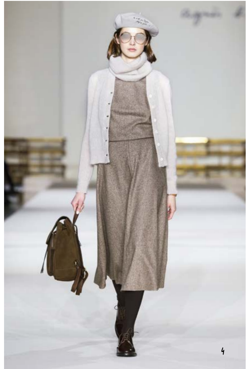
cardigan boutons en mohair beige robe, jupe évasée en tweed de laine marron beige mohair cardigan with buttons brown woollen tweed dress with flared skirt ROBE ZA17 T260 394 / GILET 90T8 LH44 341 / TOUR DE COU 91T8 LH44 341 DERBY 927B CU01 395 / BERET BEIGE SÉRIGRAPHIE ARCHIVE MONTRE BRACELET VOYAGE / SAC A DOS 939B CU11 3050 LUNETTE MIRROR VOYAGE