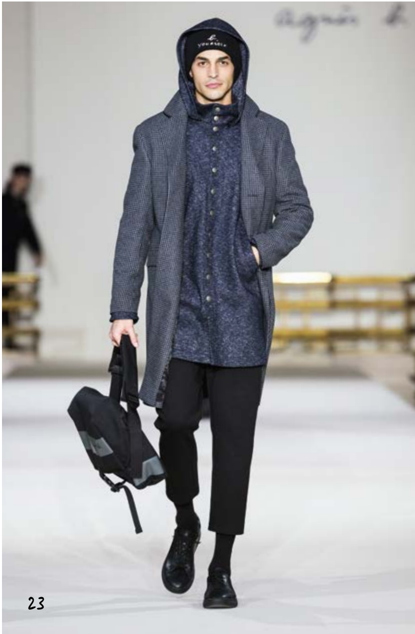
manteau pied de poule de laine gris et noir long cardigan pression en milano de laine et coton chiné bleu à pression bronze pull col rond en laine mérinos noir / pantalon court en milano de coton noir wool grey and black hound's tooth check coat long blue marl cardigan in wool and milano cotton with bronze snap fastenings short black milano cotton short trousers MANTEAU M882 CZ40 805 / MANTEAU H198 JEUO 695 / PULL O808 LP72 000 PANTALON N632 J617 000 / SNEAKERS 371B CU01 000 / BONNET B YOURSELF ARCHIVE SAC A DOS N657 VNN6 000