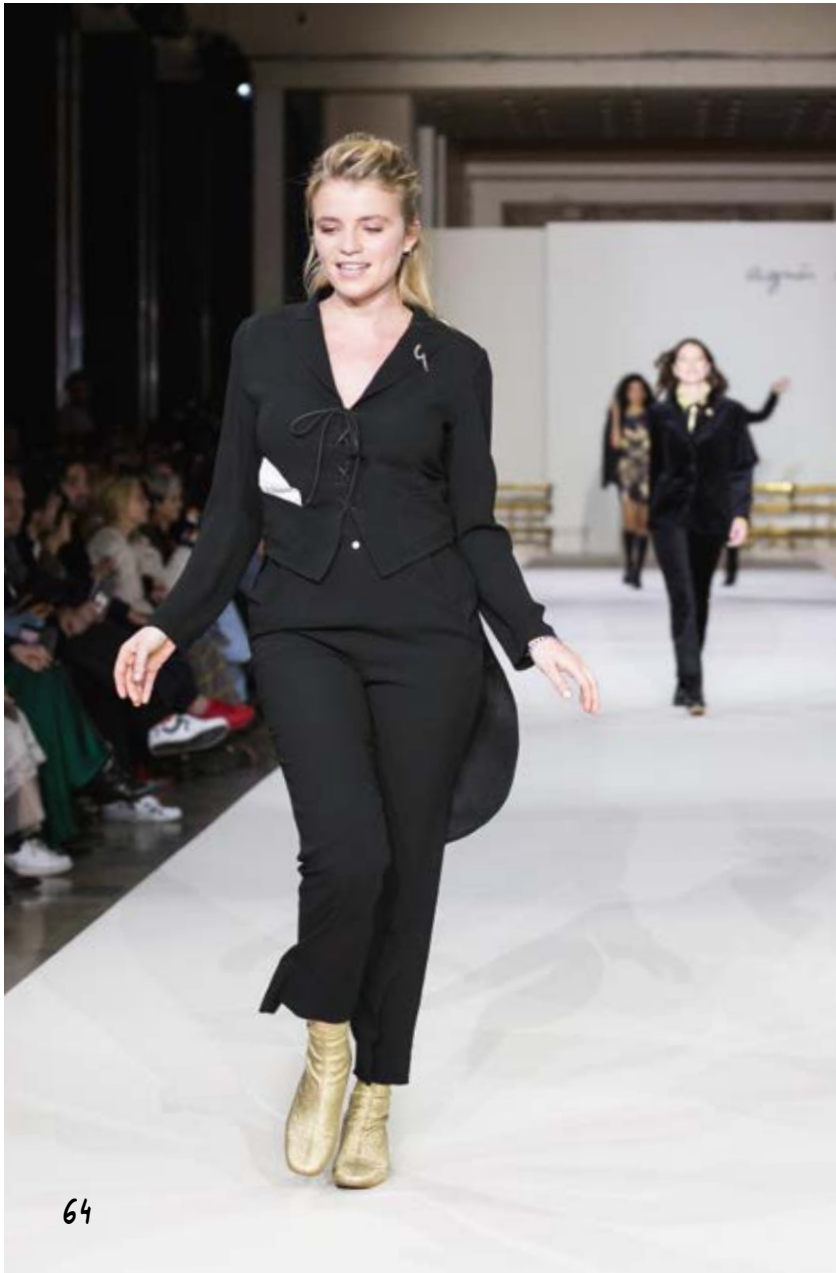
veste queue de pie laçage et pantalon en crêpe envers satin noir black jacket with tails and lacing and crepe trousers with satin on inside

QUEUE DE PIE L599 U700 000 PANTALON PRESSIONS Y303 U700 000 BOOTS 929B KF55 050 PIN'S POINT D'IRONIE ARCHIVE