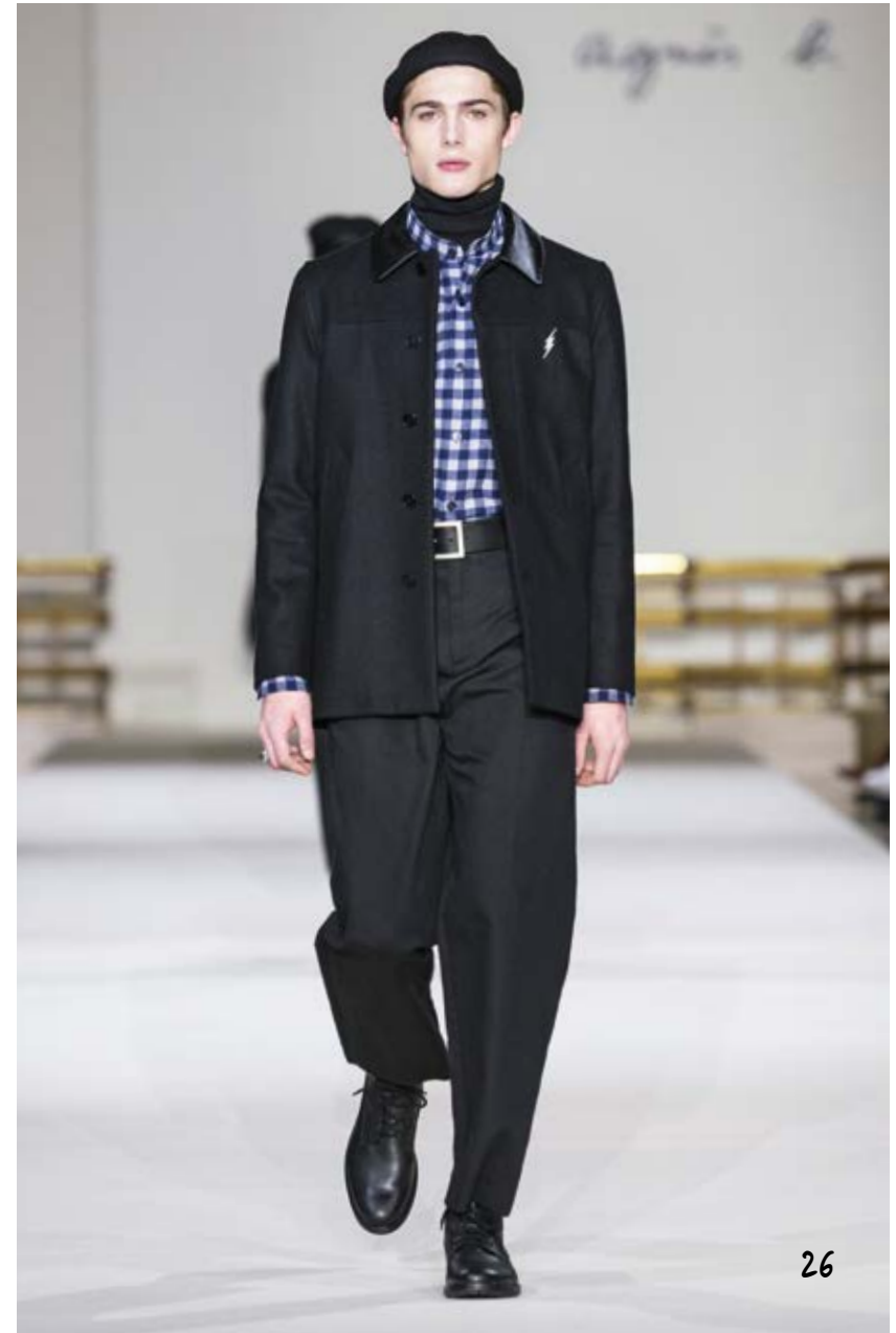
26 veste en kabig noir col cuir / chemise coton émérisé à carreaux gris et bleu nuit col droit tee-shirt en jersey noir sérigraphie "liberté, égalité, fraternité" sur tee shirt col montant en jersey de coton noir / large pantalon en toile de coton noir dos élastiqué black kabig jacket with leather collar / emerised cotton shirt with grey and midnight-blue checks and stand-up collar / black jersey T-shirt with "liberté, égalité, fraternité" screen print over black cotton jersey T-shirt with stand-up collar / wide-leg trousers in black cot- ton cloth, elasticated at back BLOUSON XB86 U308 000 / PULL COL ROULÉ 6171 LP72 000 / CHEMISE W919 CZ26 6091 PANTALON Y707 UF03 000 / BOOTS QUEBEC 545B CU17 000 / BONNET JONATHAN 515A KE82 645 CHEVALIERE CARRÉE 2085 AH60 000 / BROCHE ÉCLAIR ARCHIVE