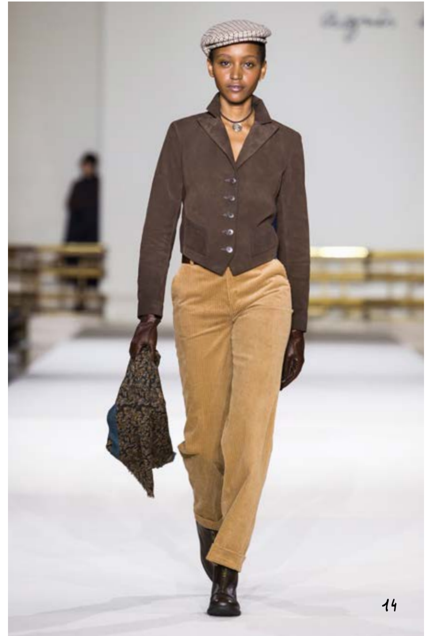
spencer en cuir velours marron pantalon garçon en velours grosses côtes beige short brown softy leather jacket boyish beige trousers in thick-ribbed velvet SPENCER XH09 CUW9 380 PANTALON 3080 UAQ9 323 ÉCHARPE IMPRIMÉ 0200 KF34 322 CASQUETTE ARCHIVE