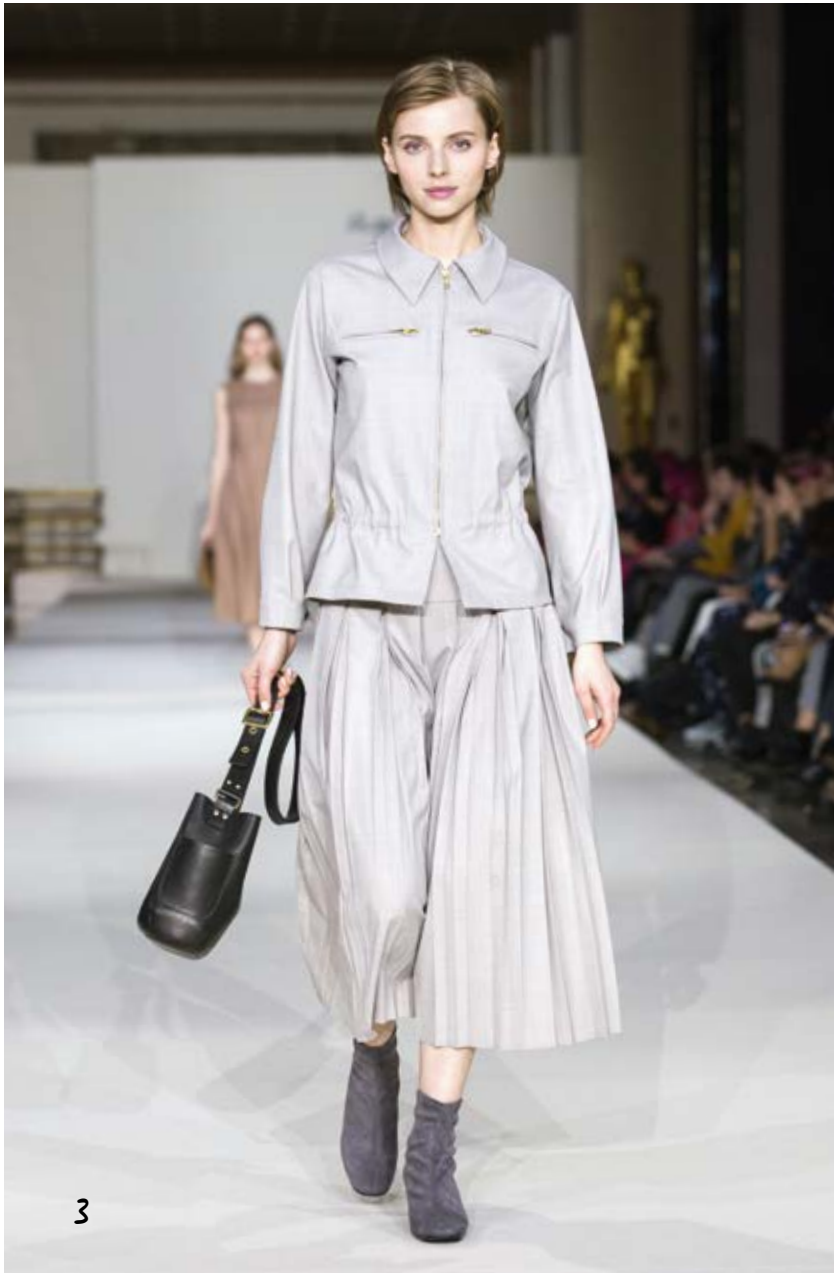
veste chemise et longue jupe plissée en laine froide beige shirt jacket and long pleated skirt in beige cool wool VESTE CHEMISE 2409 TBK4 356 JUPE 0674 TBK4 356 BOTTINE CHAUSSETTE GRISE 613B KB1 800 SAC N503 VCK3 000