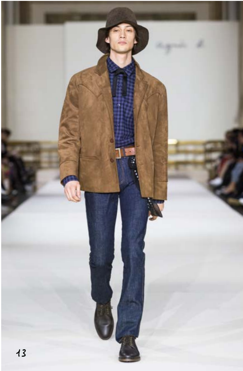
veste western en simili croûte de cuir / chemise en coton gratté à carreaux gris et bleu pantalon 5 poches en denim marine cowboy-style jacket in imitation grain leather brushed cotton shirt with grey and blue checks / 5-pocket navy denim trousers VESTE WESTERN X656 UAN8 384 / CHEMISE C874 CZ33 6107 JEAN'S Y672 G048 6060 / DESERT BATISPTE 546B CU17 000 NEUD PAP 906B KE94 000 / CEINTURON SCOTTY 127B CU17 000 BANDANA ARCHIVE 000 / CHAPEAU 888B AN42 000 BOOTS QUEBEC 545B CU17 393