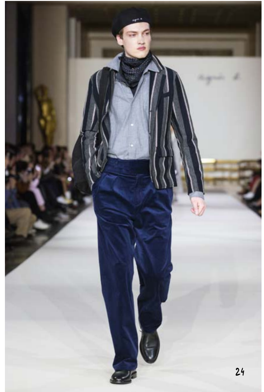
veste jersey à larges rayures en milano de coton / chemise en coton émerisé gris débardeur à côtes en jersey de coton noir / pantalon large en velours de coton 500 raies bleu milano cotton jersey jacket with broad stripes / grey emerised cotton shirt ribbed tank top in black cotton jersey wide-leg blue trousers in fine-ribbed cotton velvet corduroy VESTE G747 JER8 695 / CHEMISE W644 TP80 808 / TS SÉRIGRAPHIÉ EZ00 SCKO 000 PANTALON Y566 UX05 685 / DERBY YANN 544B CU17 000 / BRETelles PIERRE 722B KESO 000 BRETE NOIR 3326 GV00 000 / FOULARD ARCHIVE / SAC MATELOT POINT D'IRONIE ARCHIVE