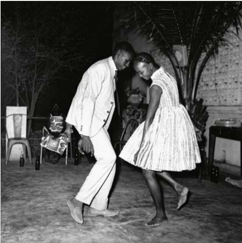
la nuit de Noël @ Malik Sidibé, 1963

56 veste et pantalon en gabardine de laine écreu chemise en popeline de coton blanc jacket and trousers in ecru wool gabardine white cotton poplin shirt VESTE XC59 U064 046 CHEMISE W851 UQ25 010 PANTALON Y626 U064 046 DERBY EN SUEDE MARRON ARCHIVE CRAVATE IMPRIMÉ 0195 IBU8 3058 ECHARPE SERIGRAPHIE MALICK SIDIBE 0200 KF62 010 TOQUE NOIR ARCHIVE