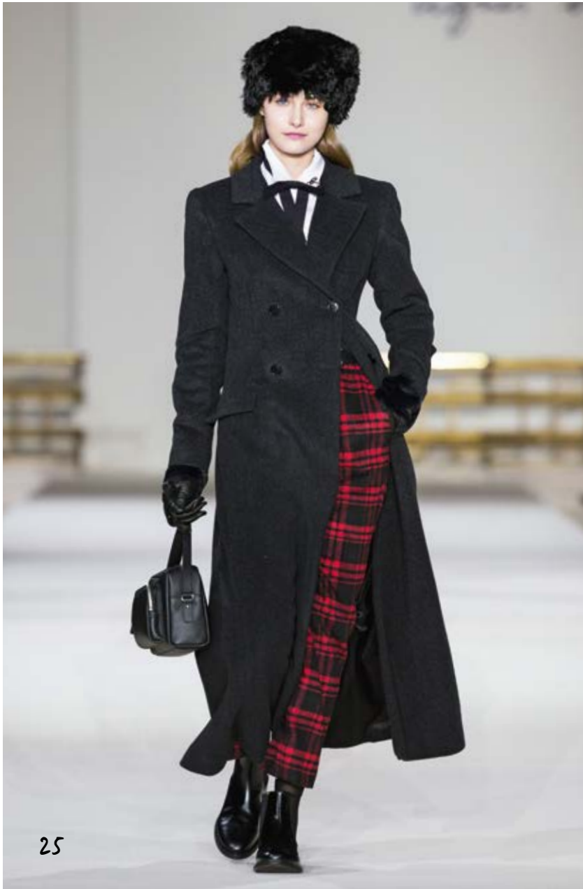
25 long manteau double boutonnage en drap de laine chinéchemise en popeline de coton blanc pantalon à carreaux rouge et noir long double-breasted coat in marled woollen cloth white cotton poplin shirt red and black checked trousers MANTEAU ADRIEN MB07 UK85 900 / GARCÓN W180 UQ36 010 PANTALON Y319 CG51 404 / BOOTS PLATE 928B CU01 000 BROCHE B ARCHIVE / GANTS CUIR ARCHIVE 000 / SAC N510 VCG8 000 NÉUD RUBAN 906B KE94 000